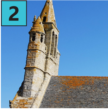
B Chapelle de Tronoën