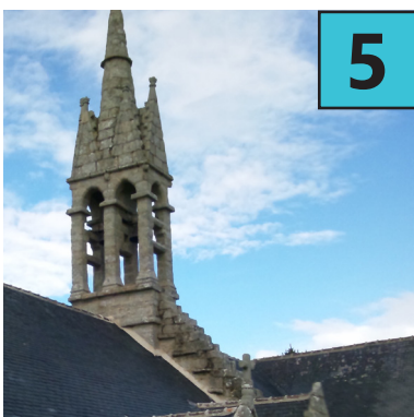
E Chapelle de Saint Vio