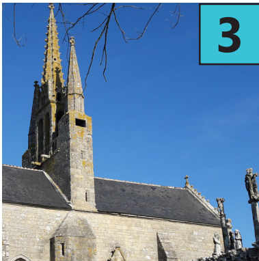
C Chapelle de Saint Trémeur