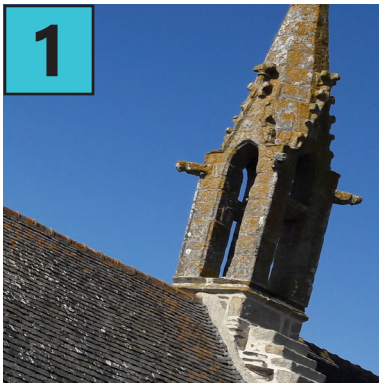
A Chapelle de la Joie