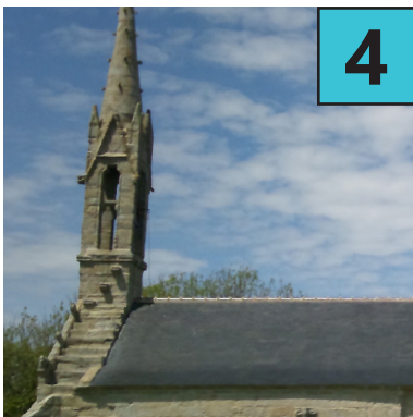
D Chapelle de Tréminou